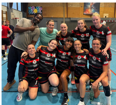
Match amical séniors féminines à Landévant