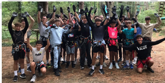
Les U18 et U15 en journée cohésion à l'accrobranche

L'agenda du supporter est créé par nous, utilisé par VOUS.