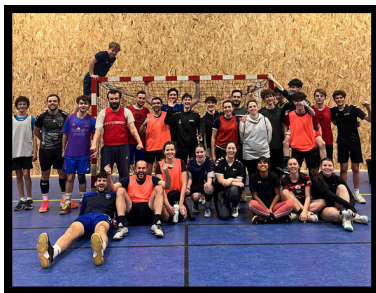
Tournoi loisirs et séniors