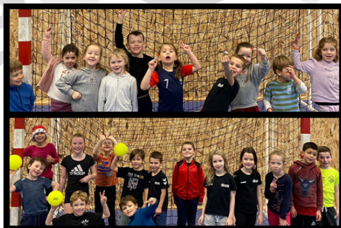
Noël Baby hand et École de hand

L'agenda du supporter est créé par nous, utilisé par vous.